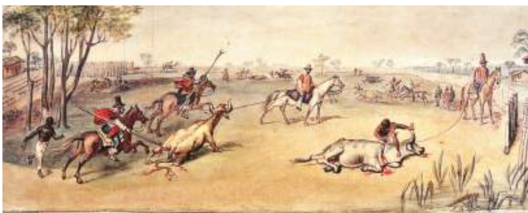
52 Fig. 31 e Fig 32 – Charqueada, início do sec. XX. Fonte: Decupagem do vídeo O Escravo no RS - A charqueada e a gênese do escravismo gaúcho. (ALVES, 2011). Fig. 33 - Aquarela Jean-Baptiste Debret. Charqueada do Brasil. 1827. Detalhe.